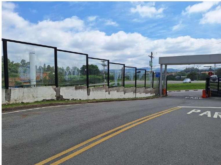
REPARO DO MURO POSTERIOR

E-MAIL: ironesolution@gmail.com TELEFONE (11) 4962-6954 END: AV JOAO BERNARDO MEDEIROS 74 - JD BOM CLIMA - GUARULHOS-SP, CEP 07.197-010 CNPJ: 30.664.283/0001-37