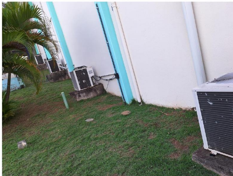
ENTORNO DO PLENÁRIO