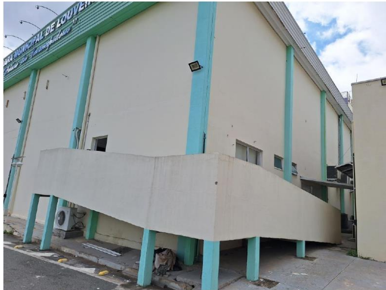
NOVA CAIXA DE INSPEÇÃO