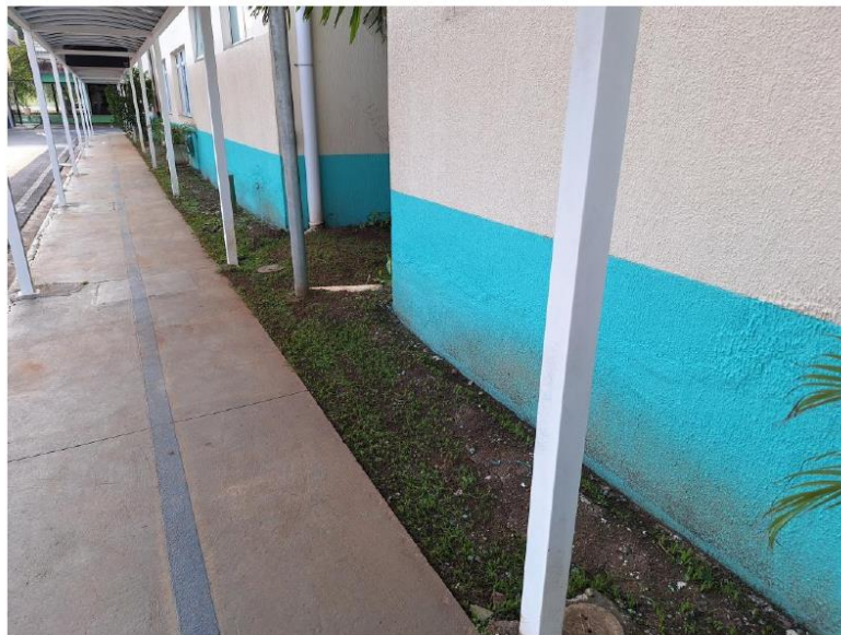
ENTORNO DOS GABINETES