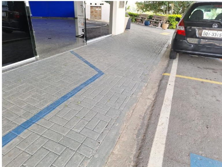
ANTIGO ABRIGO DO CAIXA ELETRÔNICO

E-MAIL: ironesolution@gmail.com TELEFONE (11) 4962-6954