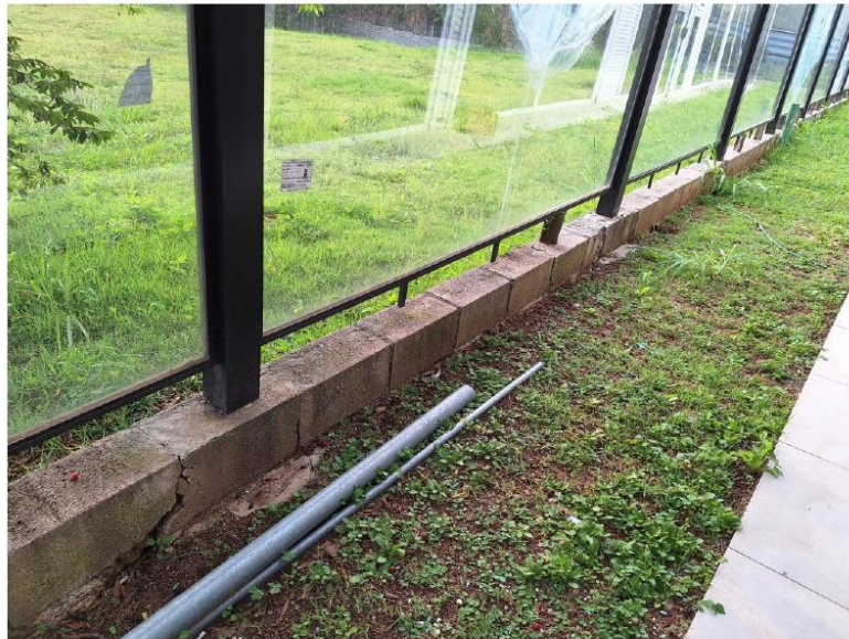
REPARO DO MURO LATERAL